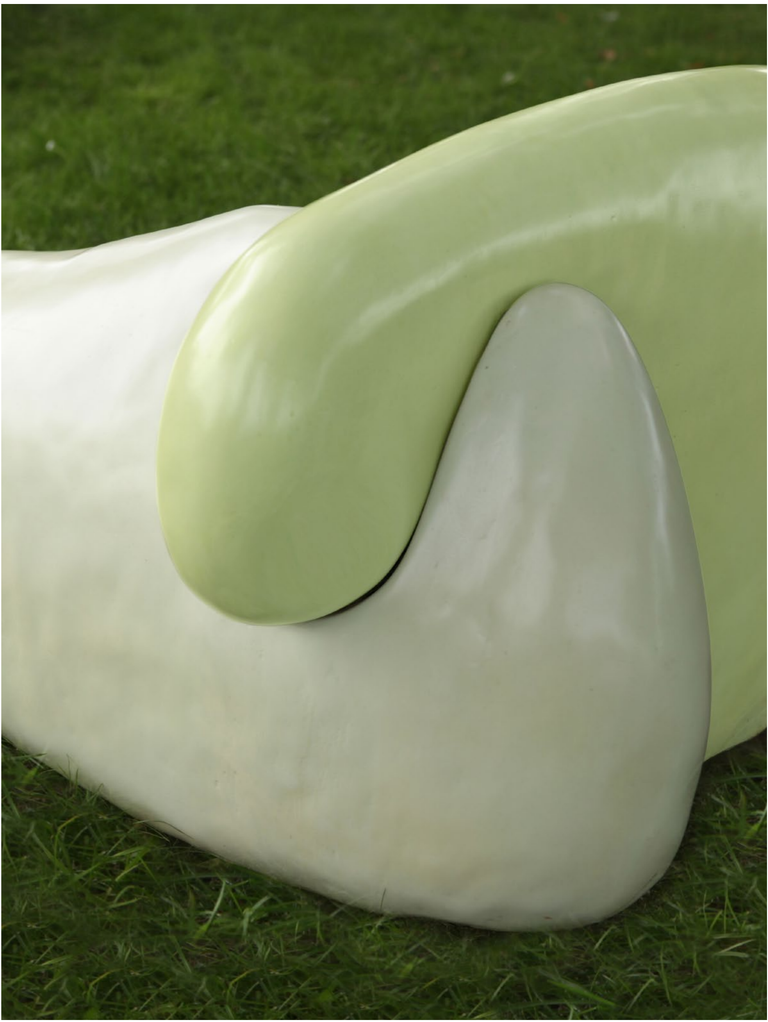
We would survive but without touch, without skin , 2021 Polystyrène, résine, tissus de verre, pigment de couleur de haut en bas : 200 x 110 x 65 cm, 230 x 35 x 190 cm