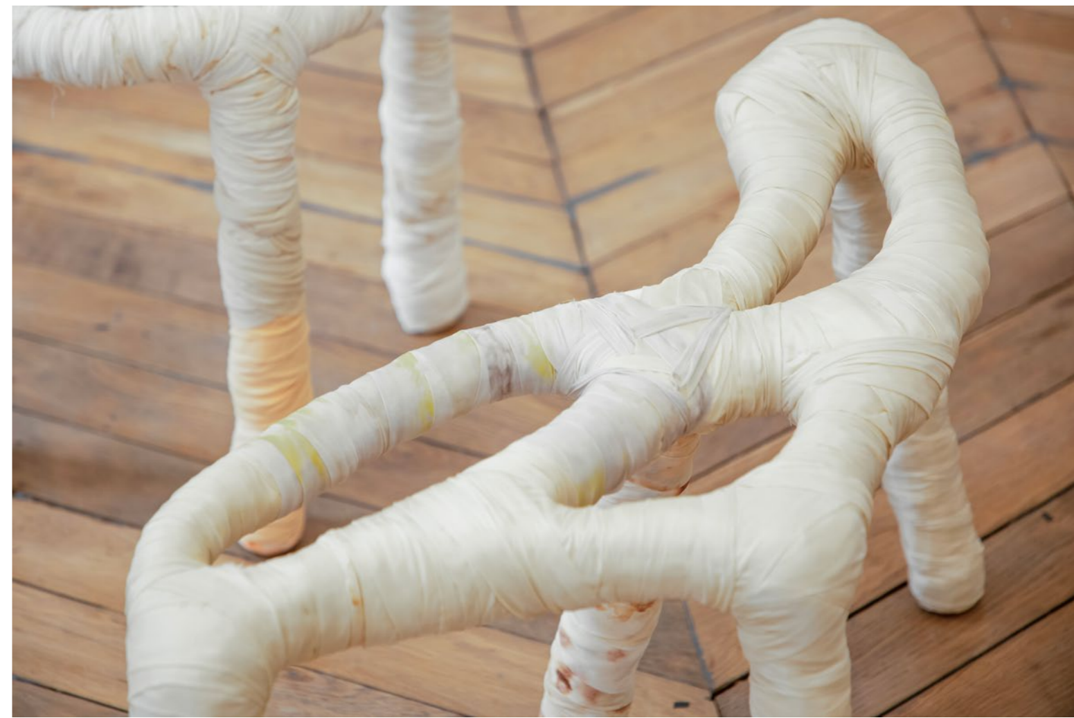
Tender Skin , 2022, Fitzaptrick Gallery, Paris Acier, tissus teints avec des fruits, légumes et plantes de haut en bas : 49 x 47 x 20 cm, 45 x 80 x 37 cm