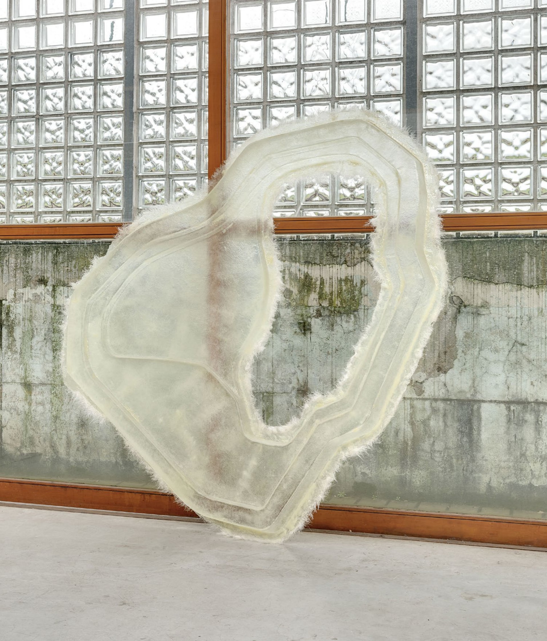
Extend & Generate , 2016 Résine, mat de verre en poudre, pigment de peinture 190 x 170 x 25 cm