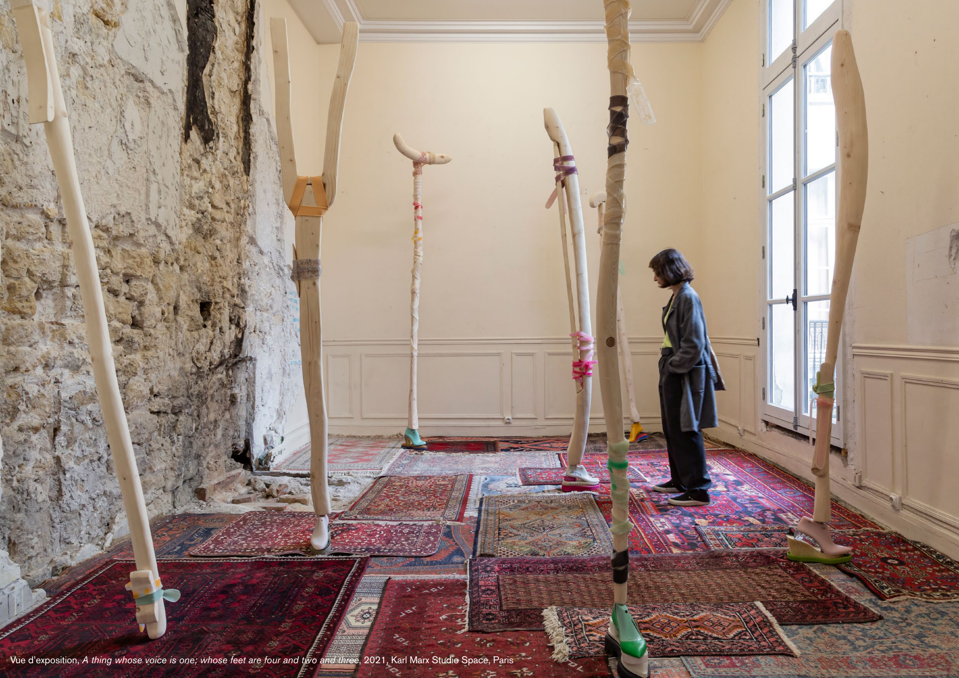
Vue d'exposition, A thing whose voice is one; whose feet are four and two and three , 2021, Karl Marx Studio Space, Paris