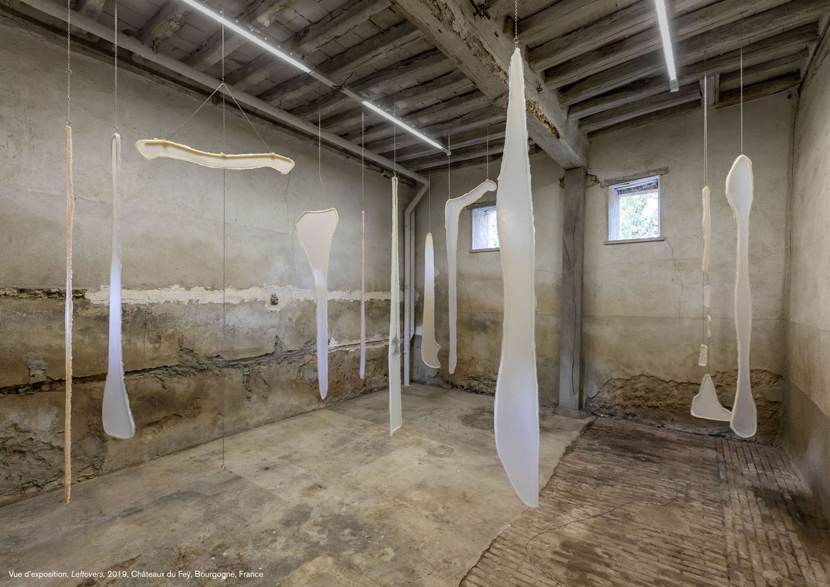
Vue d'exposition, Leftovers , 2019, Châteaux du Feÿ, Bourgogne, France