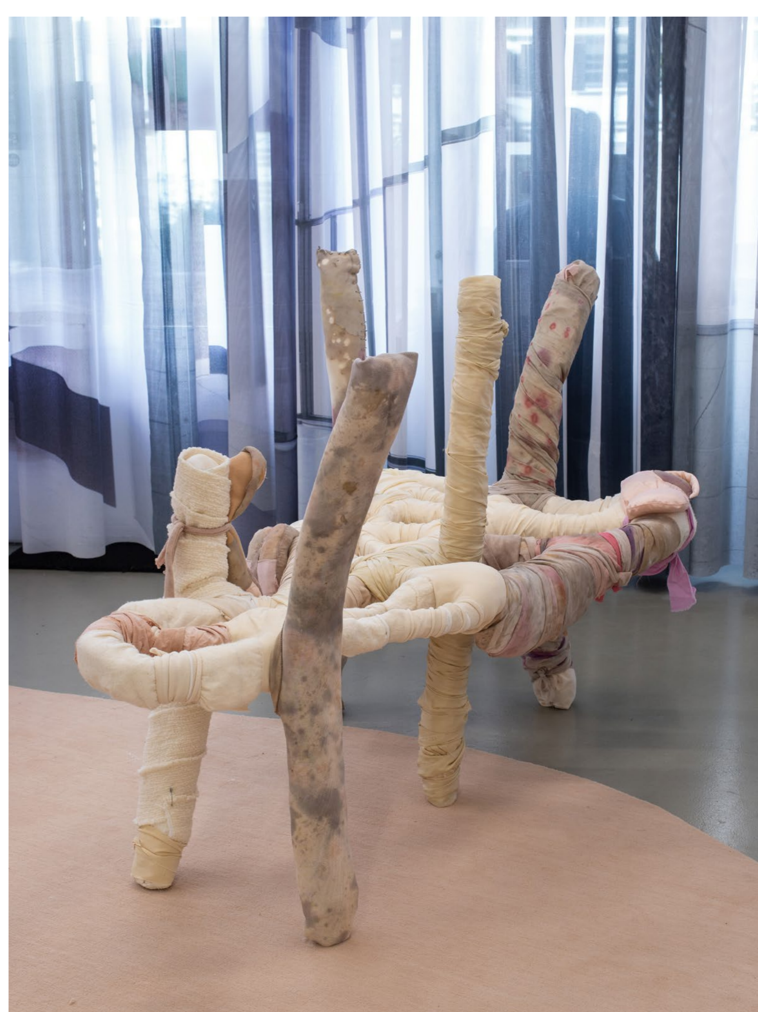
Tender Skin , 2020, Galerie 22,48 m 2 , Paris Acier, tissus teints avec des fruits, légumes et plantes 155 x 80 x 100 cm