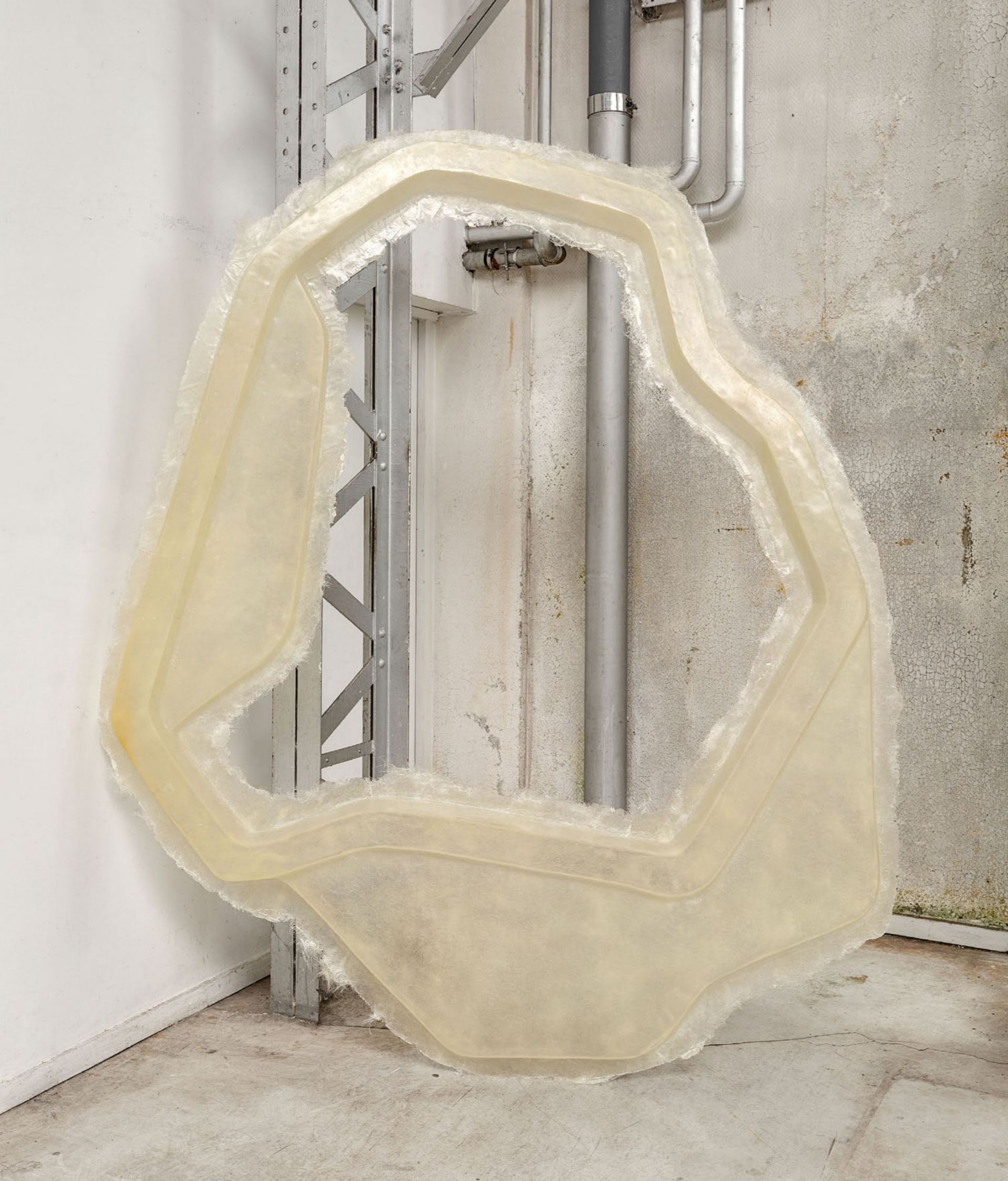
Extend & Generate , 2016 Résine, mat de verre en poudre, pigment de peinture 200 x 180 x 25 cm