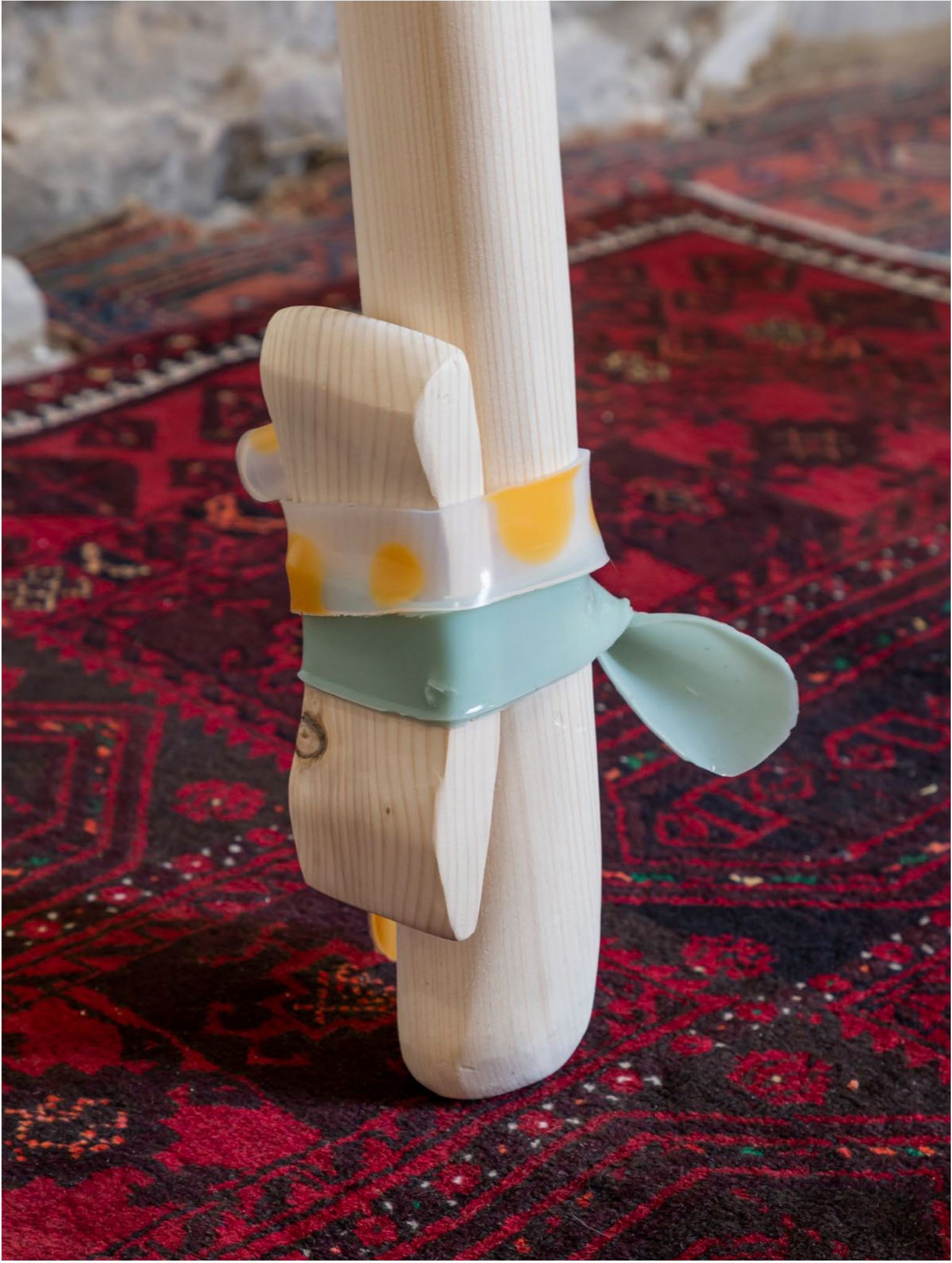
Untitled (hips) , 2021 Bois, silicone, pigment de couleur, pigment de chrome 330 x 90 x 15 cm