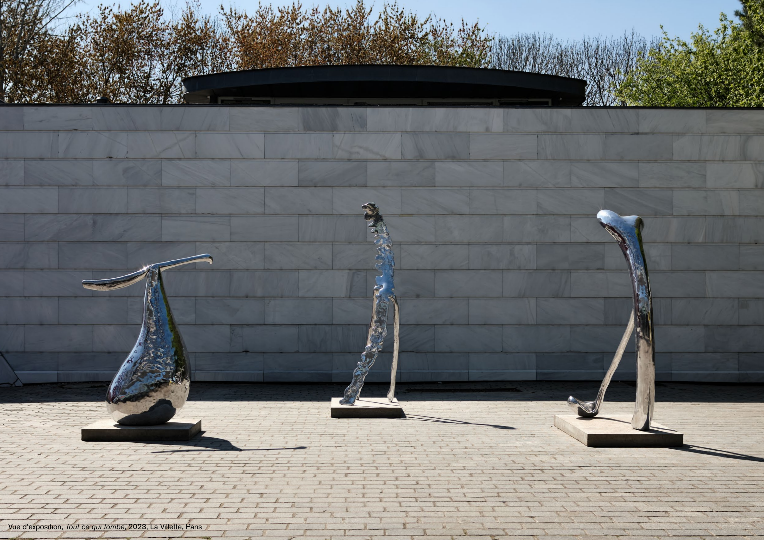
Vue d'exposition, Tout ce qui tombe , 2023, La Villette, Paris