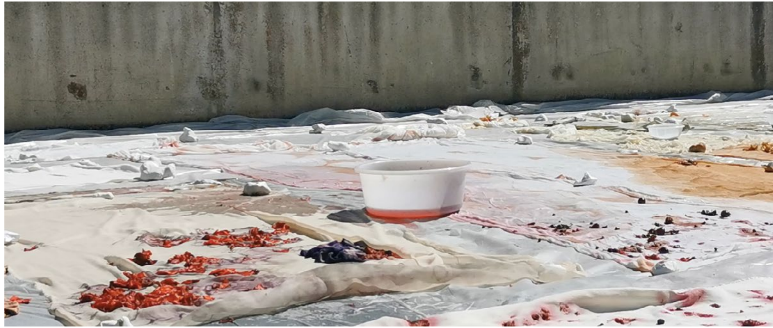
Variations des cœurs , 2021, performance [11h - 20h | 13/062021], Studio Orta, Les Moulins, FR Tissus blancs, silex, plâtre, eau, bassine, reste de fruits, légumes et plantes