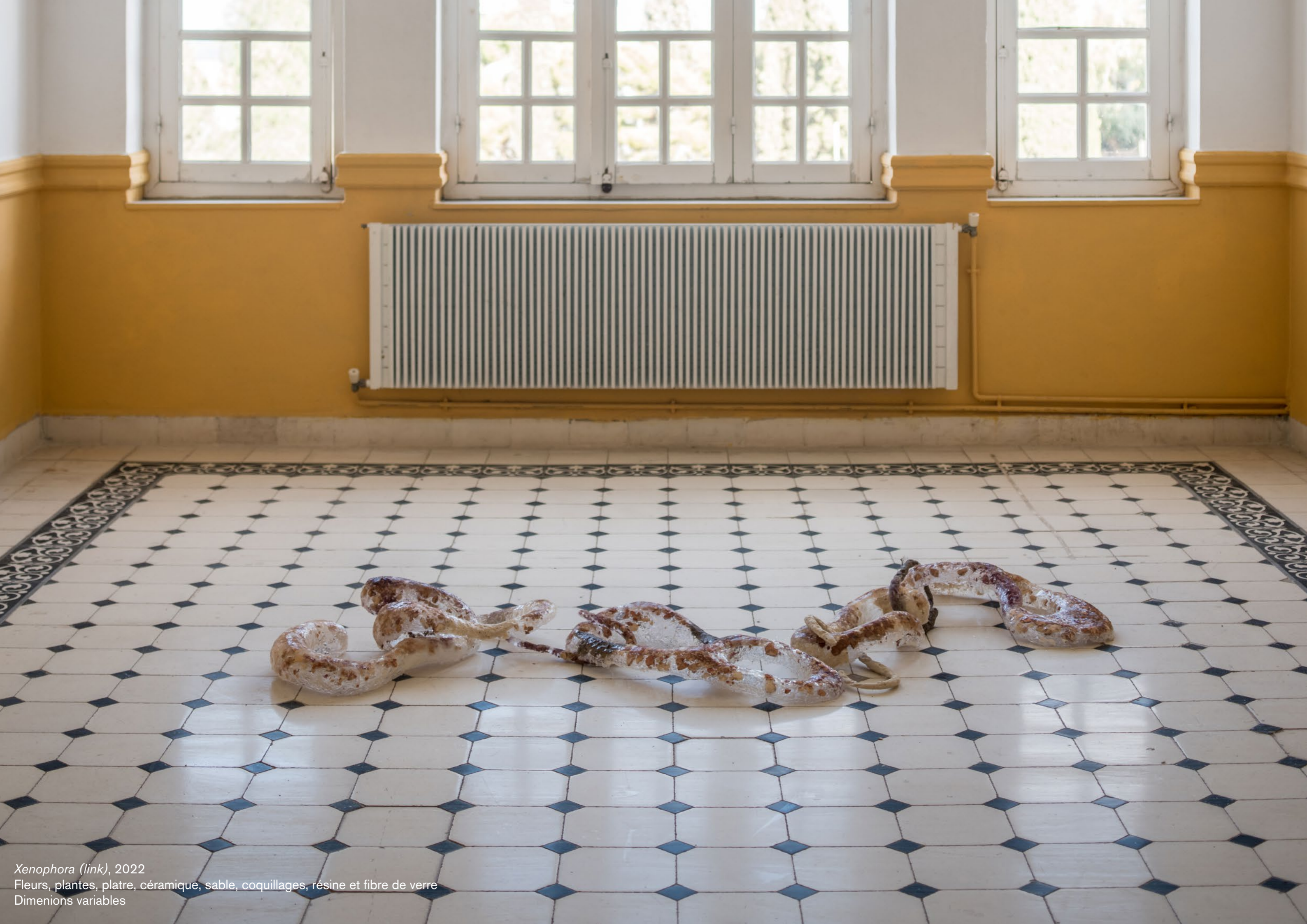
Xenophora (link) , 2022 Fleurs, plantes, plâtre, céramique, sable, coquillages, résine et fibre de verre Dimension variables