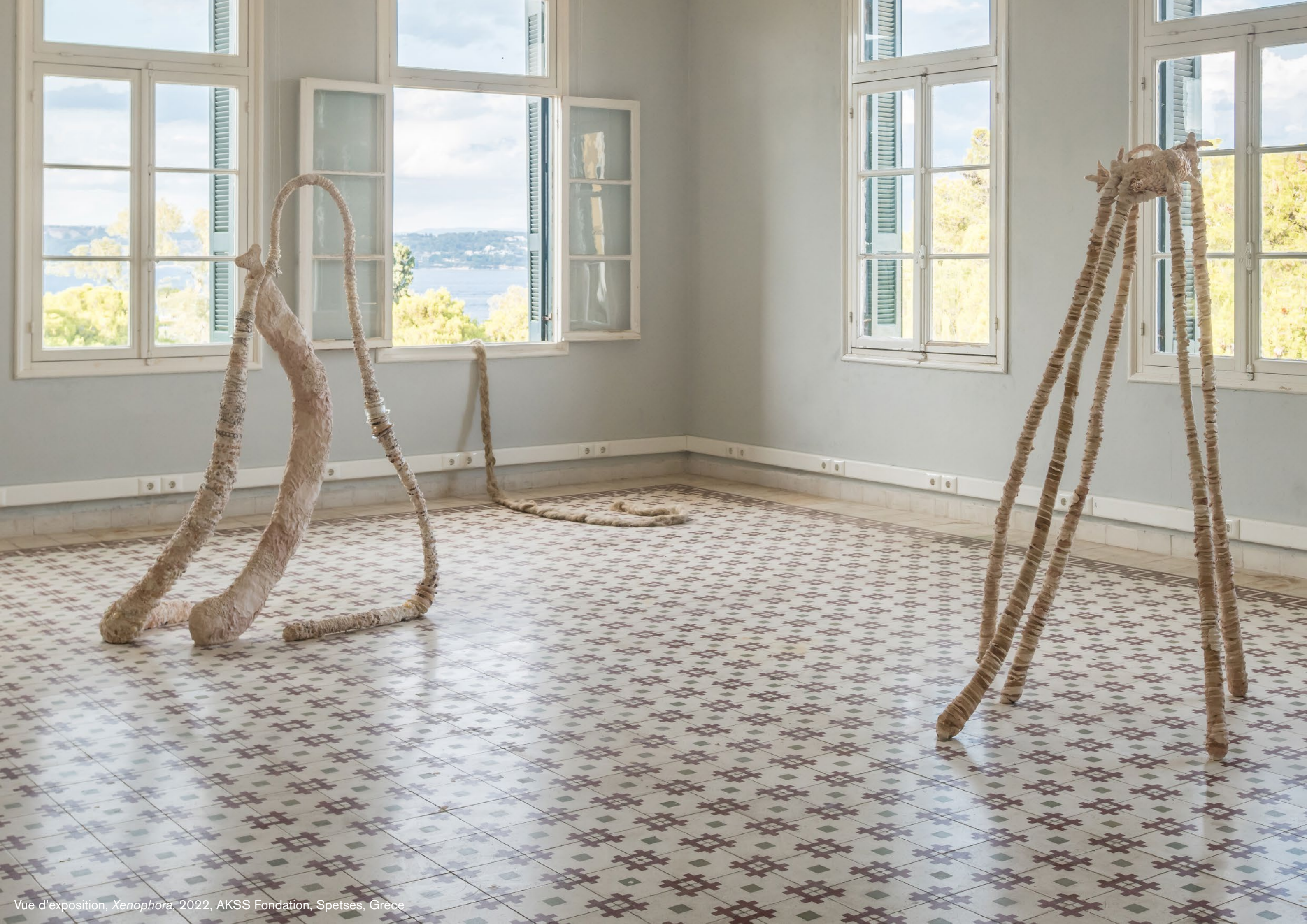
Vue d'exposition, Xenophora , 2022, AKSS Fondation, Spetses, Grèce