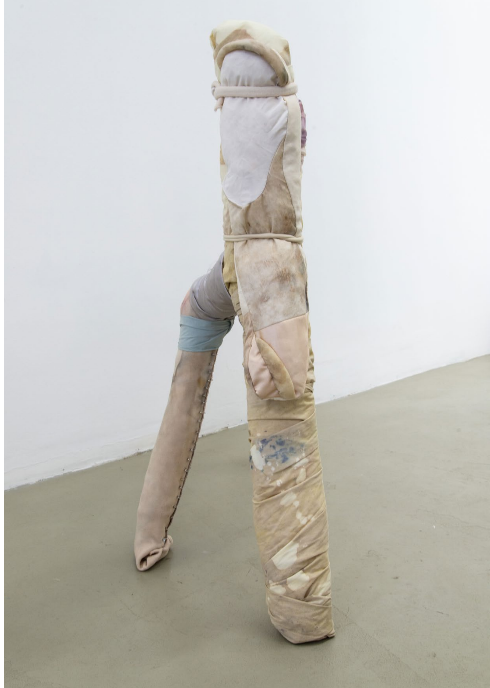
Tender Skin , 2020, Galerie 22,48 m 2 , Paris Acier, tissus teints avec des fruits, légumes et plantes 80 x 25 x 90 cm