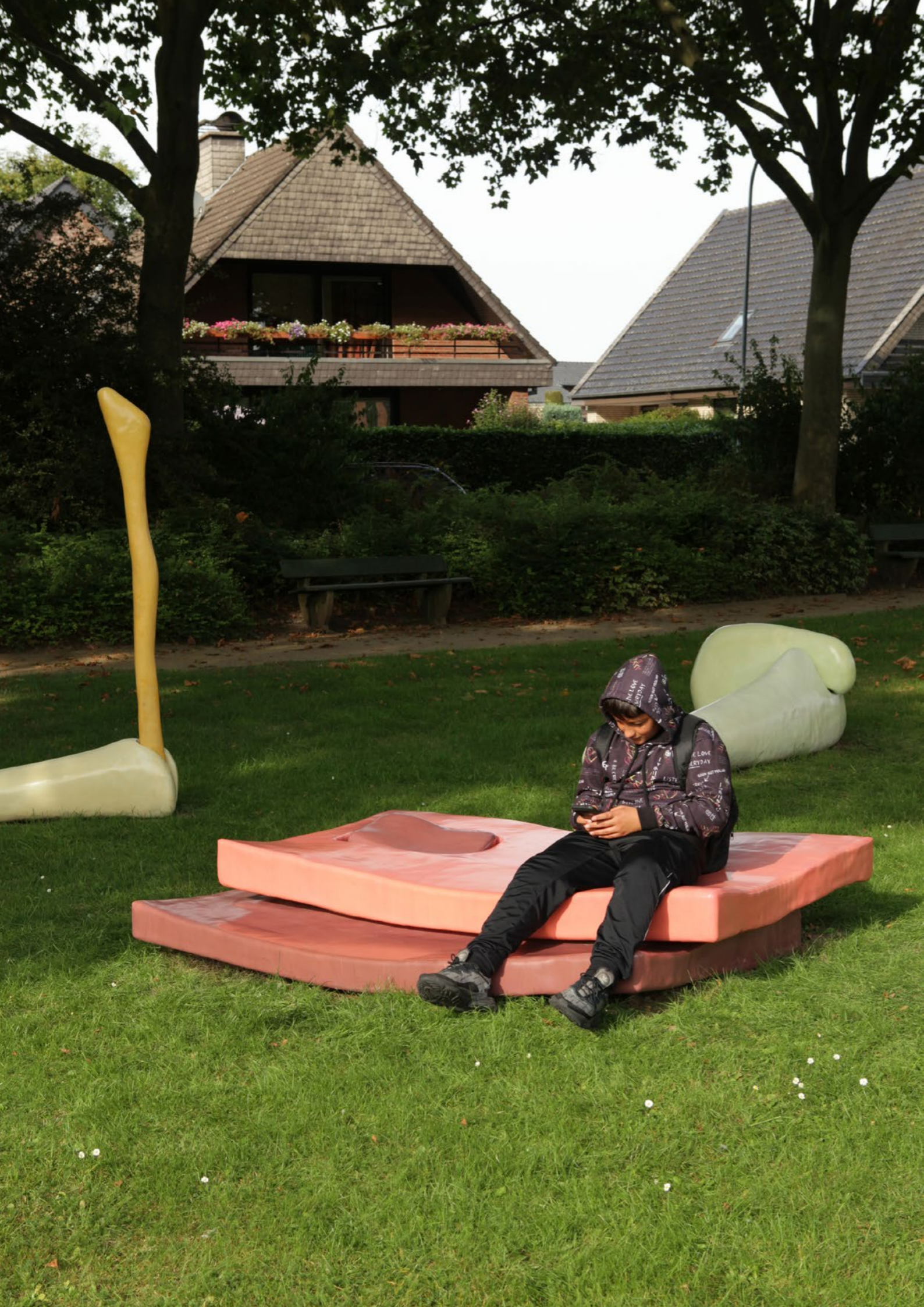
We would survive but without touch, without skin, 2021 Polystyrène, résine, tissus de verre, pigment de couleur 220 x 200 x 40 cm