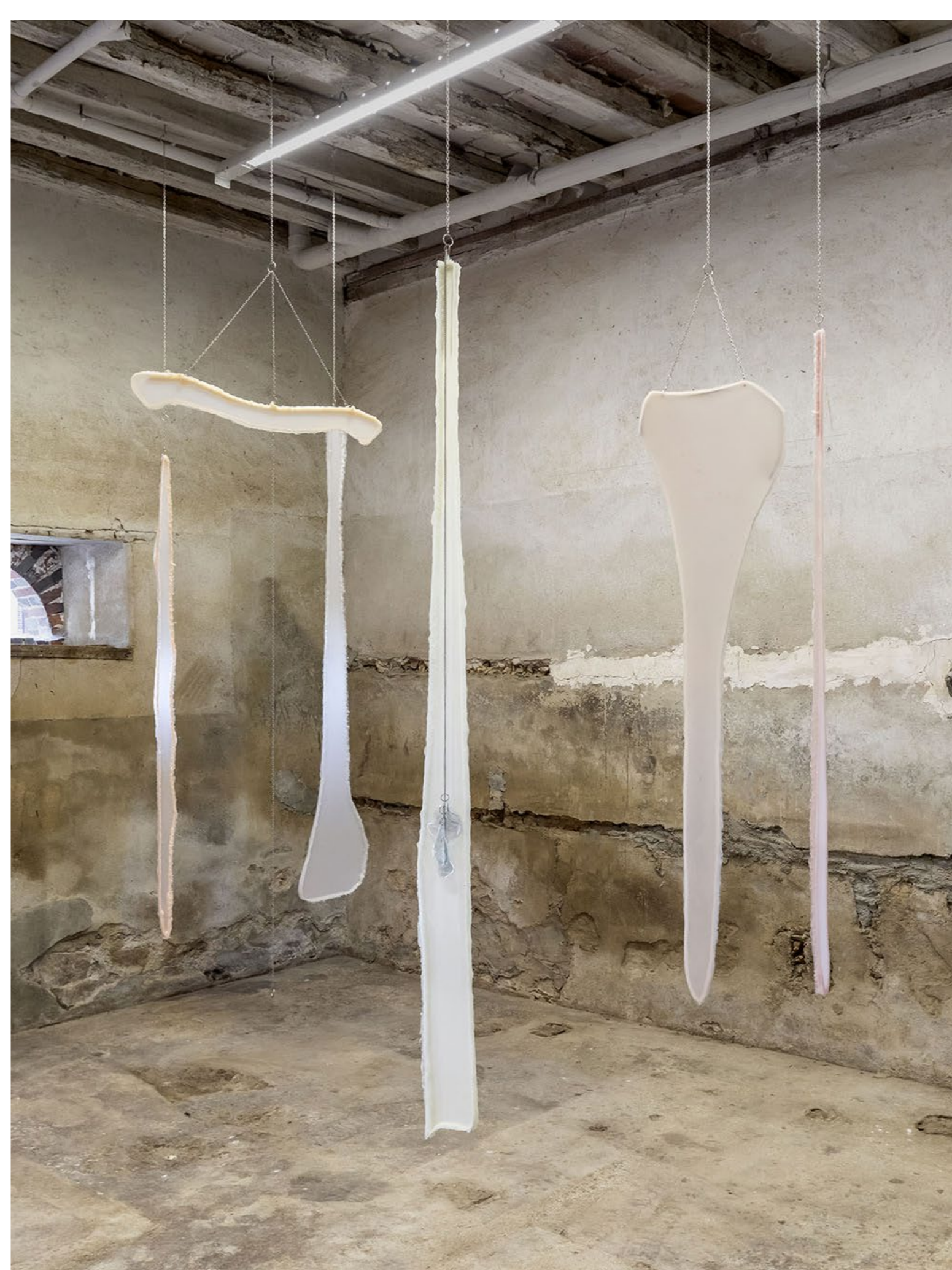
Leftovers , 2019 Silicone, pigment de peinture, chaîne en métal Dimensions variables