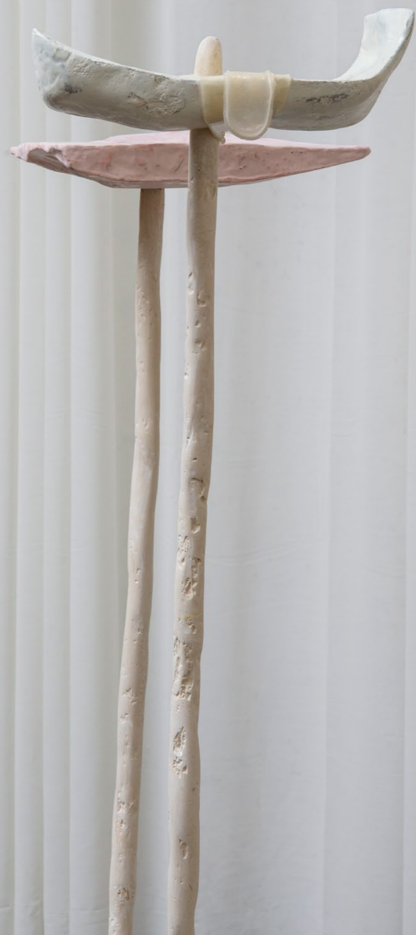
Ce qu'on chérit , 2019 Acier, polystyrène, résine acrylique, silicone, pigment de peinture 120 x 80 x 150 cm