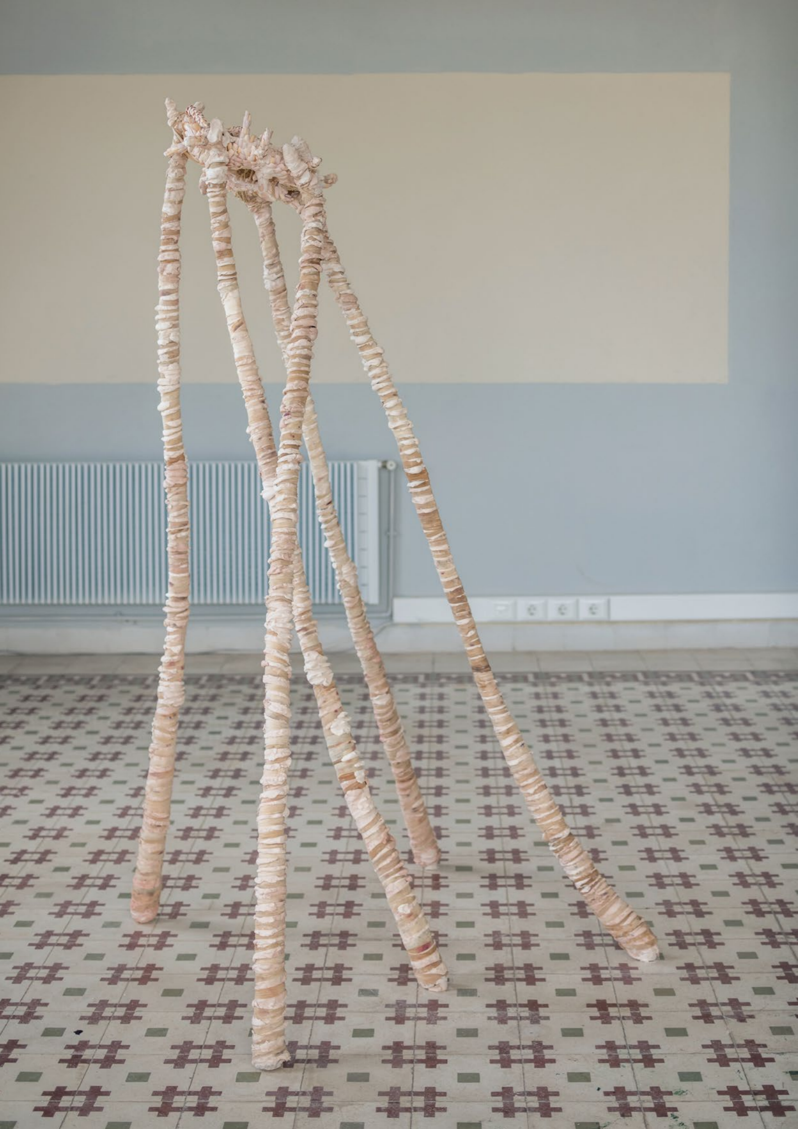
Xenophora (mother) , 2022 Céramique, faux ongles, tissus (soie, coton, tont avec des restes de végétaux), corde, acier 210 x 100 x 120 cm