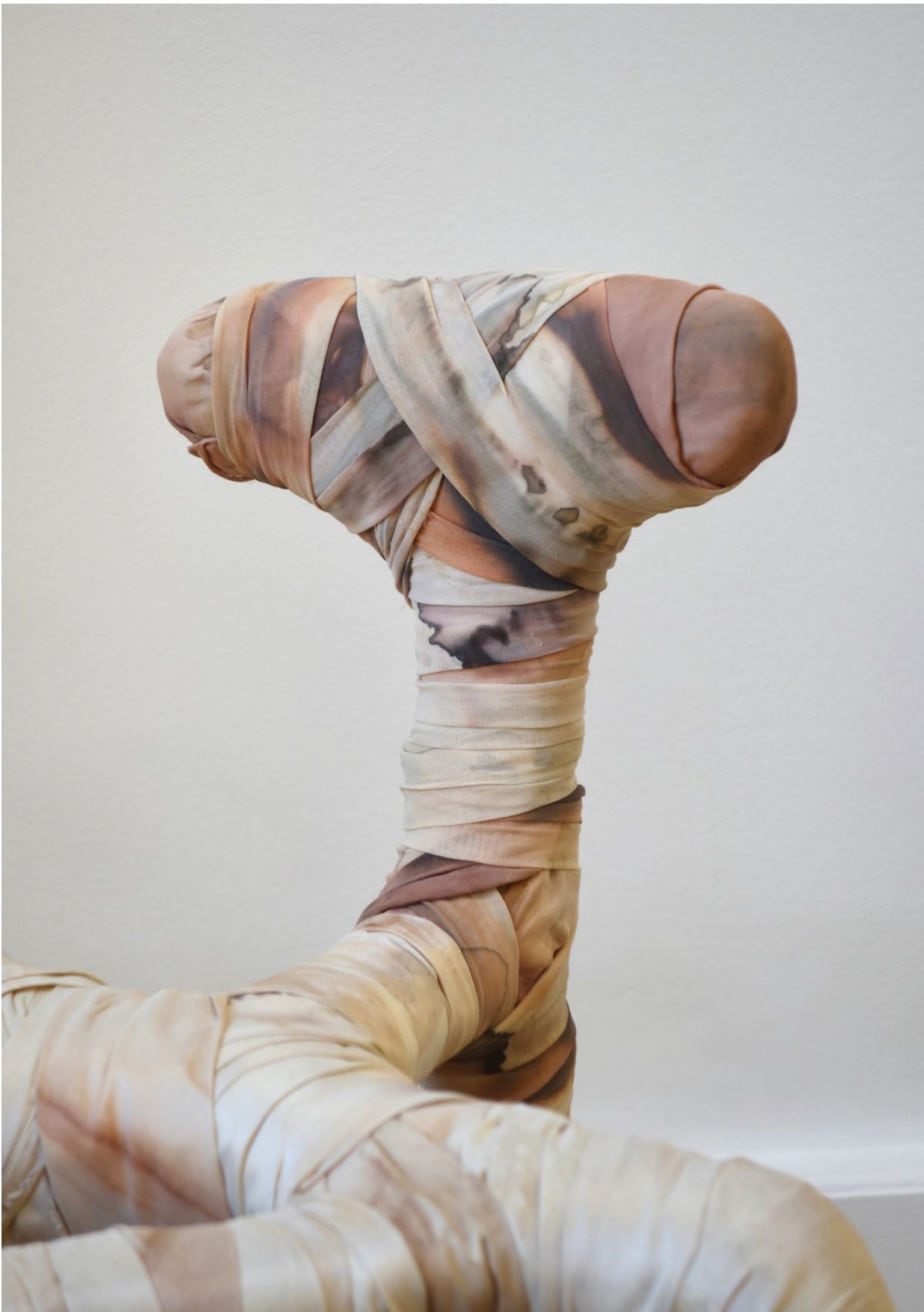
Tender Skin , 2022, Fitzpatrick Gallery, Paris Acier, tissus teints avec des fruits, légumes et plantes 64 x 37 x 36 cm