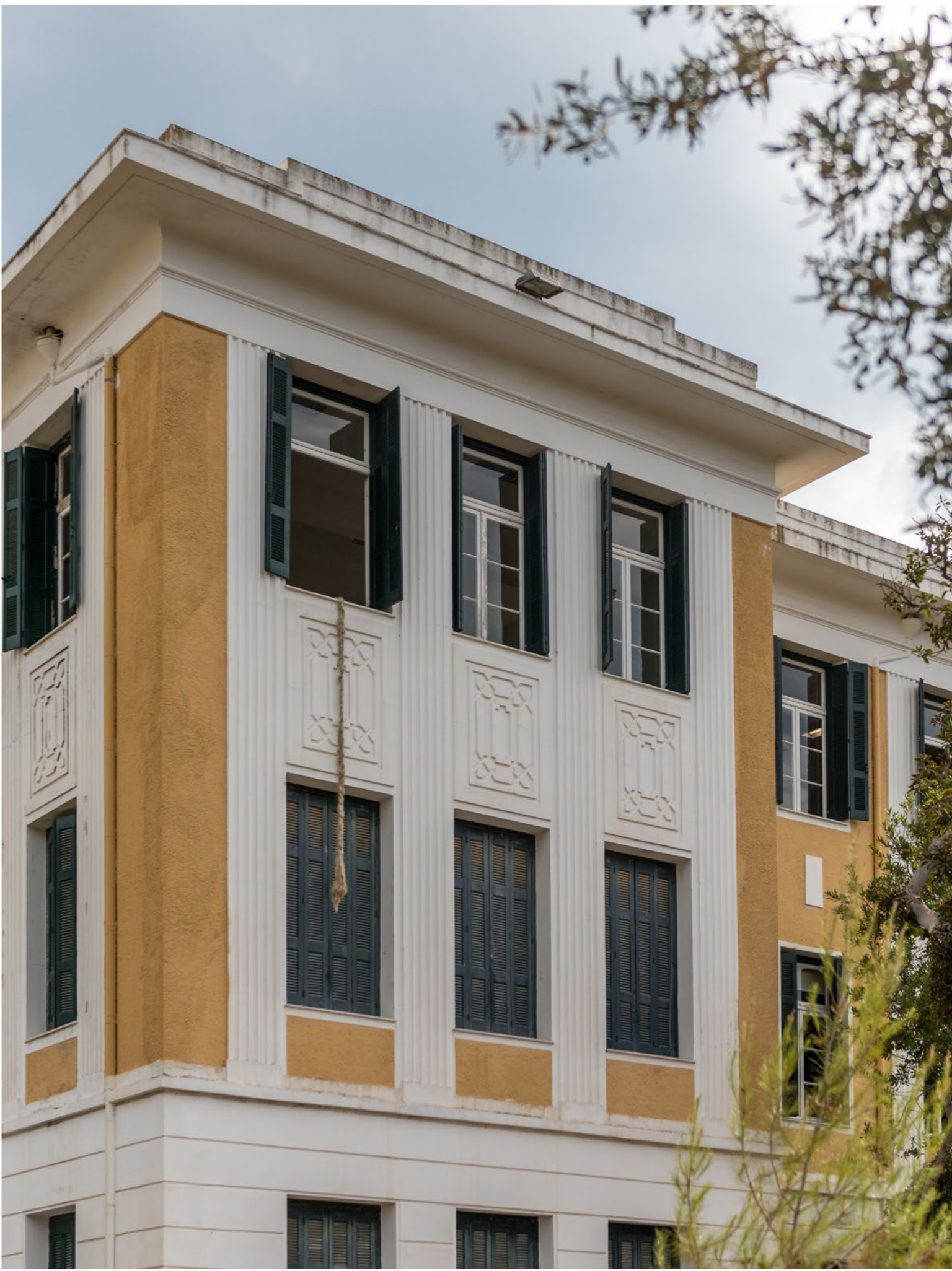
Xenophora (Sila) , 2022 Chanvre 600 x 10 cm