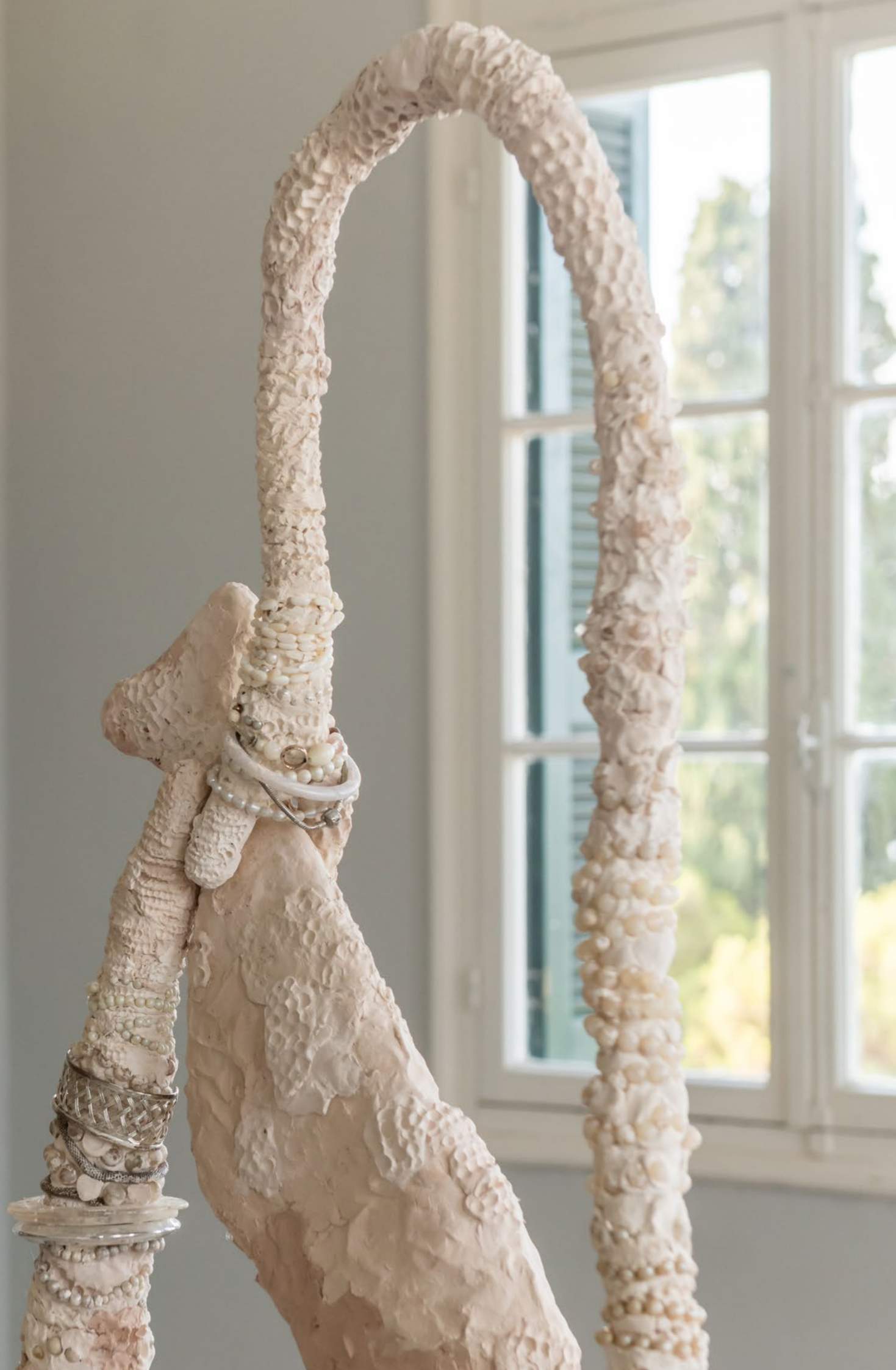
Xenophora (kiss) , 2022 Céramique, acier, perles et bracelets crée avec divers techniques 180 x 110 x 110 cm