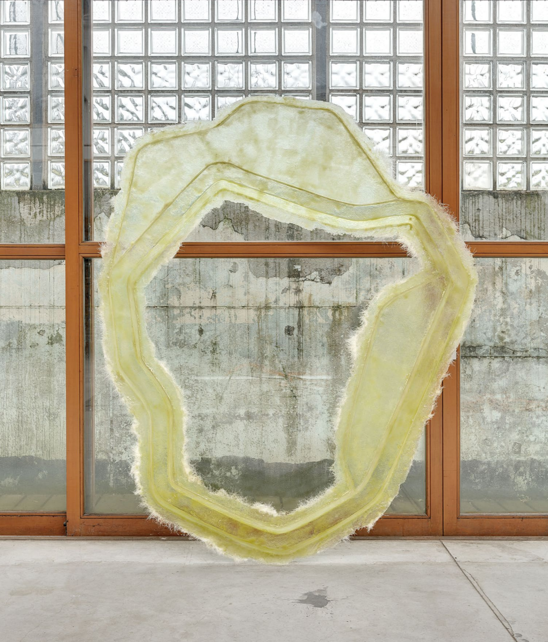
Extend & Generate , 2016 Résine, mat de verre en poudre, pigment de peinture 200 x 180 x 25 cm