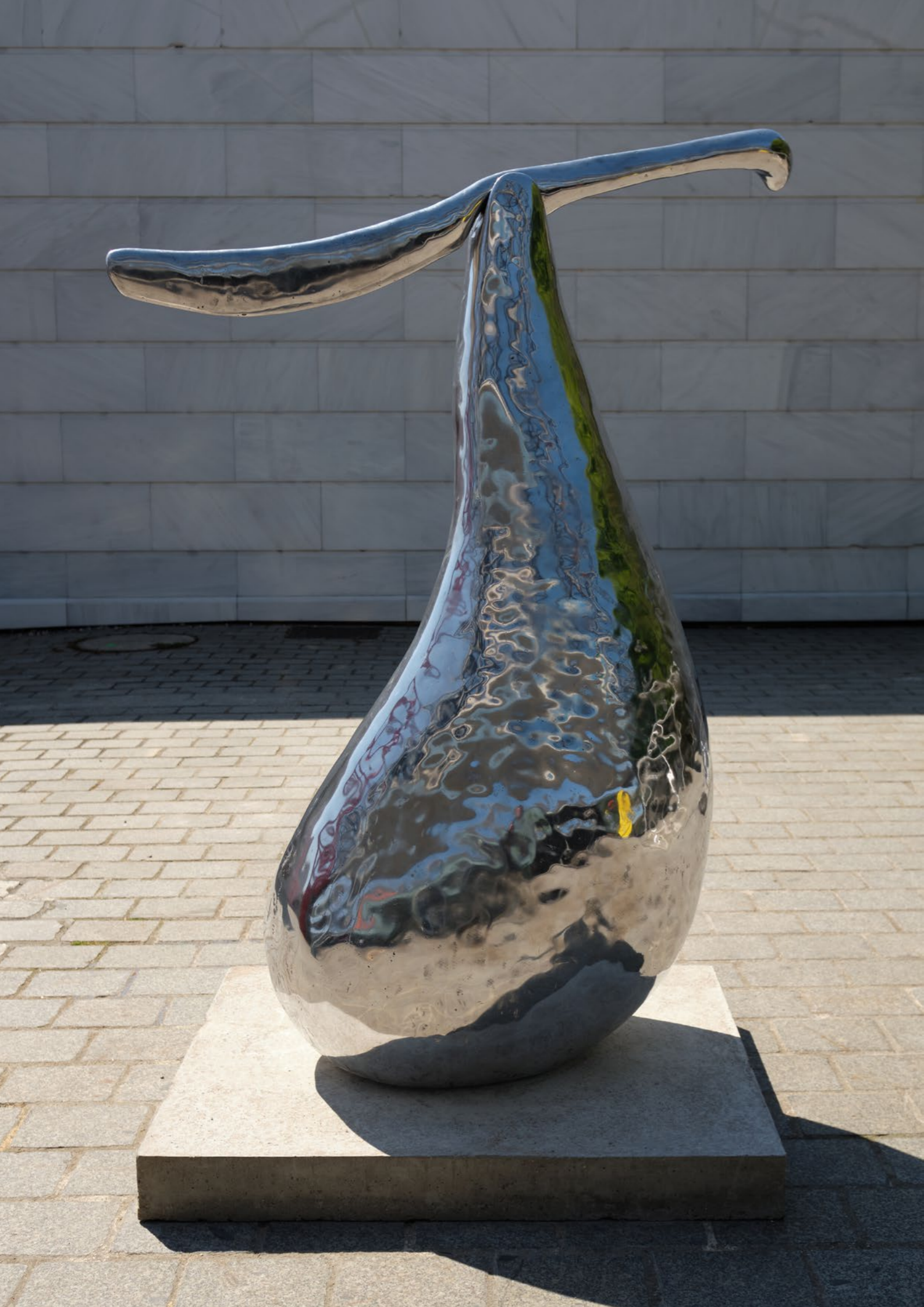
Tout ce qui tombe , 2023 Aluminium 146 x 75 x 60 cm