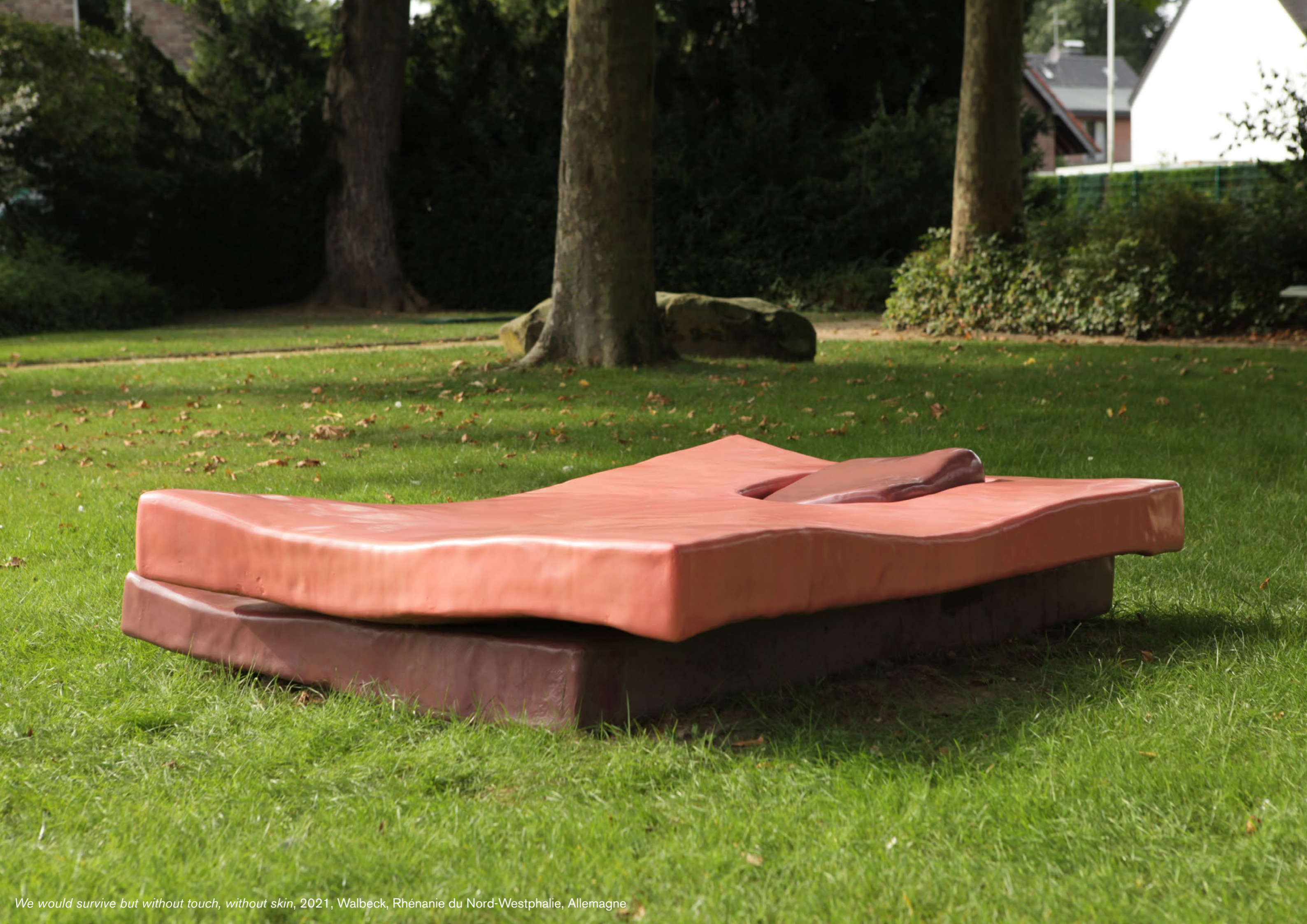
We would survive but without touch, without skin , 2021, Walbeck, Rhénanie du Nord-Westphalie, Allemagne