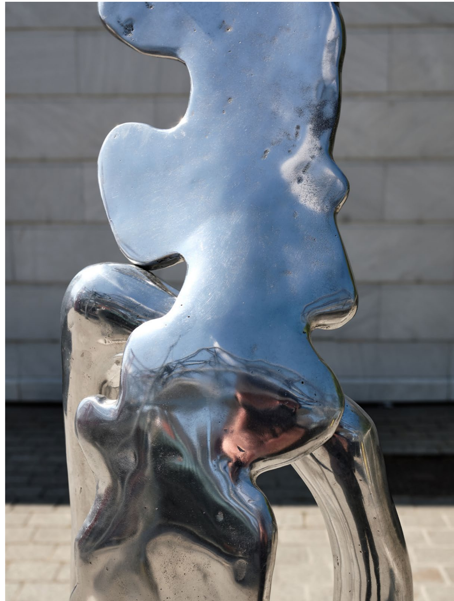
Tout ce qui tombe , 2023 Aluminium 220 x 80 x 60 cm